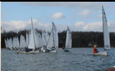
2. ročník: Těrlicko 2008