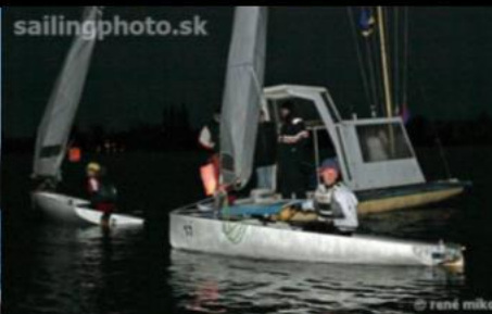
3. ročník: Senec 2009