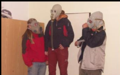
1. ročník: Chomoutov 2007